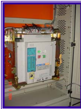
ภาพจากหน้างานจริงที่ ห้างสรรพสินค้า เดอะ มอลล์