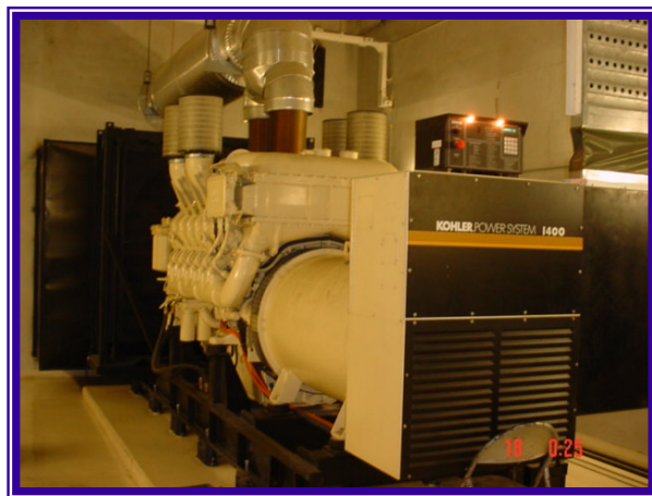
ภาพจาก Big C สาขาราชดำริ

ห้างสรรพสินค้า Big C เป็นหนึ่งในบริษัทฯ ที่เลือกซื้อผลิตภัณฑ์ KOHLER และบริการจากชาरिकันอย่างต่อเนื่องมาเป็นเวลานาน ด้วยการออกแบบวางแผน และติดตั้งเครื่องกำเนิดไฟฟ้าที่ปราณีต และได้มาตรฐานความปลอดภัย รวมทั้งการทำงานของทีมงานที่คล่องตัว และเชี่ยวชาญ ทำให้ห้างสรรพสินค้า Big C เชื่อมั่นและเลือกใช้เครื่องกำเนิดไฟฟ้าจากบริษัทฯ เรามาโดยตลอด