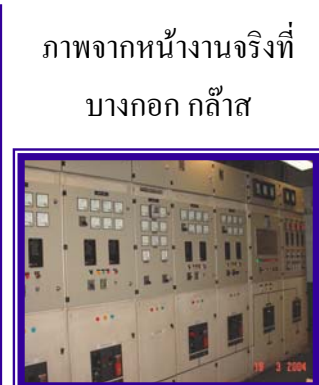
ภาพจากหน้างานจริงที่ บางกอก ก๊าซ