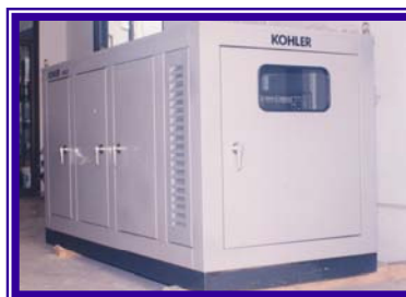
Sound Proof Enclosure

“From bid to startup and beyond, we’re there to make sure your system performs to your specifications.”