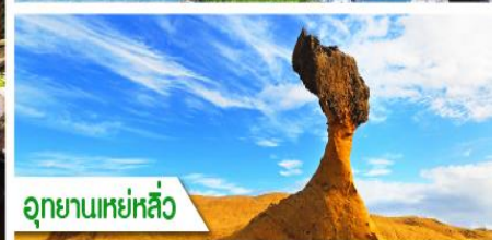
อุทยานเหย่หลิว