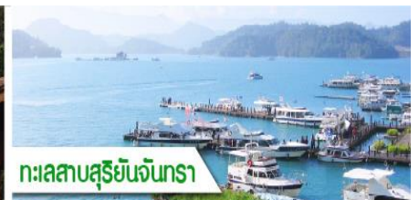
ทะเลสาบสุริยัมจันตรา