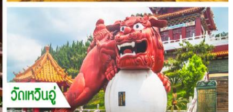
วัดเหวินอู่