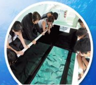
ล่องเรือกระเจก

EASY ทัวร์ญี่ปุ่น โอกินาว่า เกาะสวาท หาดสวรรค์ 4 วัน 2 คืน