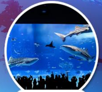
ดูราอุ่มอควาเรียม