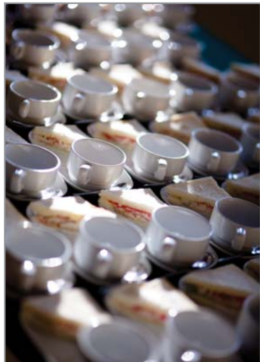
ลองเอามาถ่ายย้อนแสงนิดๆ ดูการเก็บรายละเอียดในทีสว่างและที่มืดก็ทำได้ แต่ย้อนแสงจะบิชอนม้องนิดๆ แต่ไม่มากจนน่าเกลียด

- การใส่ของโทนสีภาพทำให้ประทับใจมาก ถึงจะไม่นุ่มนวลเหมือนเลนส์ค่าย แต่ก็สามารถปรับแต่งได้ง่าย ใครว่าสีเพี้ยนสำหรับผมว่ากลางๆ แต่กลับชอบโทนสีที่เลนส์ตัวนี้ทำได้