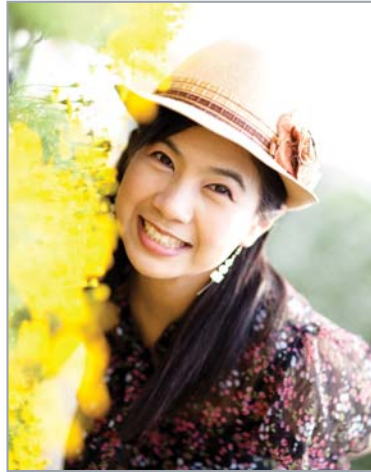
การเปิดรูรับแสงกว้างสุด เพื่อเล่นละลายฉากหน้าและฉากหลัง อีกทั้งภาพยังดูสดใส

- ความสวยงามของโบเก้ออยู่ในระดับประทับใจ ให้โบเก้ดวงไฟที่กลมและใหญ่มาก สามารถเรียกสร้างสรรค์ภาพแนวนี้ได้อย่างง่ายดายสามารถมองหาและสร้างโบเก้ด้านหน้าได้ง่าย