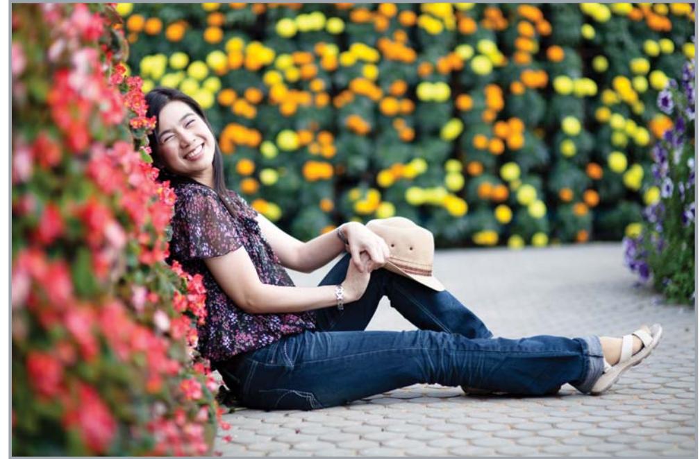
ระบบความชัดทำได้ดีมาก เมื่อใช้กล้องตัวจะสามารถคุมระยะชัดได้ตามที่ต้องการ

- การใส่ของโทนสีภาพทำให้ประทับใจมาก ถึงจะไม่นุ่มนวลเหมือนเลนส์ค่าย แต่ก็สามารถปรับแต่งได้ง่าย ใครว่าสีเพี้ยนสำหรับผมว่ากลางๆ แต่กลับชอบโทนสีที่เลนส์ตัวนี้ทำได้