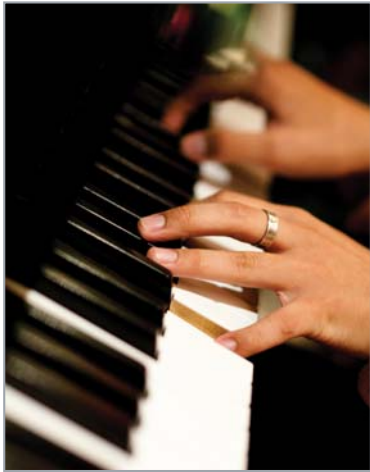
ในที่แสงน้อยมาก สามารถเล่นกับรูรับแสงกว้างๆ โดยการคุมระยะชัดตามที่ต้องการได้ ทำให้เกิดเรื่องราวต่อไป

- รูรับแสงกว้างสุดที่ใช้งานได้จริง เมื่อใช้คั่นมือ การเปิดรูรับแสงกว้างๆ ในค่าต่างๆ ระบายความชัดทำได้ดีมาก เรียกว่า ให้คะแนนประทับใจสุดๆ เมื่อเริ่มที่รูรับแสงตั้งแต่ f/1.6 เป็นต้นไป f/1.4 ก็ใช้ได้แต่ต้องมั่นใจจริงๆ ว่าแบบต้องไม่ขยับไม่ฉั่นหลุดระบายความชัดไป