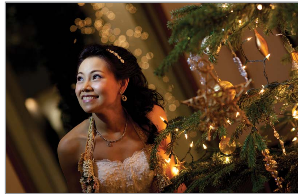
การโฟกัสที่ชัด ทำให้ได้ ใบไม้ดี ในสภาวะแสงน้อย การเปิดรูรับแสงกว้าง ก็ทำให้เราได้ความไวชัตเตอร์ที่เพิ่มขึ้น ทำให้ได้ภาพกลางคืนได้มากขึ้น