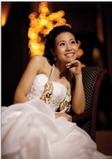
การถ่ายภาพกลางคืน โบเก้มีลักษณะกลมสวย และ f/1.4 ใช้งานไว้จริง

- ความสวยงามของโบเก้ออยู่ในระดับประทับใจ ให้โบเก้ดวงไฟที่กลมและใหญ่มาก สามารถเรียกสร้างสรรค์ภาพแนวนี้ได้อย่างง่ายดายสามารถมองหาและสร้างโบเก้ด้านหน้าได้ง่าย