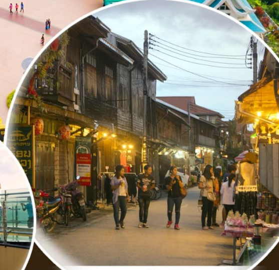
ถนนคนเดินเชียงใหม่

ไหว้ปูย่า ลอดท้องพญานาค คำชะโนด วัดป่าภูก้อน สวนหินผางาม ปันจักรยานริมฝั่งโขง เมนูพิเศษ! ข้าวเป็ยกเส้นเชียงคาน ข้าวจี่ป่าเตี